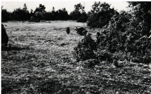
Fig. 3. Habitat of Euxoa vitta Esp. in Gotland, Hørsne; "alvar" partially covered with juniper scrubs.

ska fjärilar. Stockholm (Nord. Familjebok). I—IV, 1—86, 1—354, pl. 1—50.